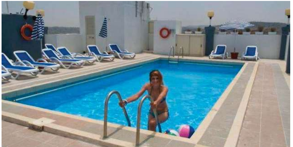
Cjenik: stranica 10.